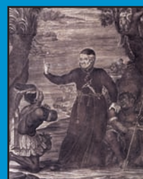
PADRE ANTÓNIO VIEIRA